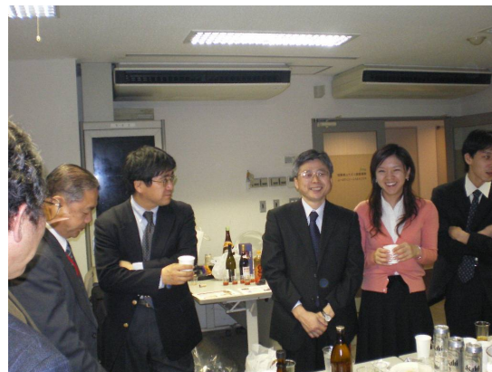
OBN協議会設立10周年記念セレモニー 懇親会の模様